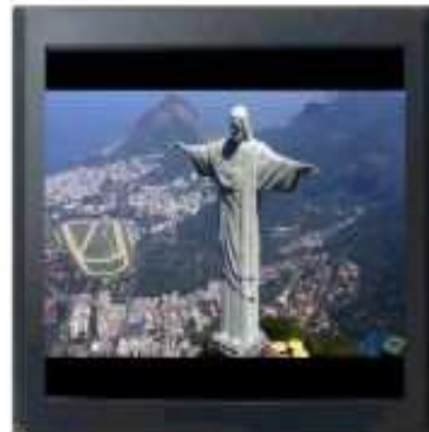
IMAGEM 4:3 COM EFEITO LETTERBOX