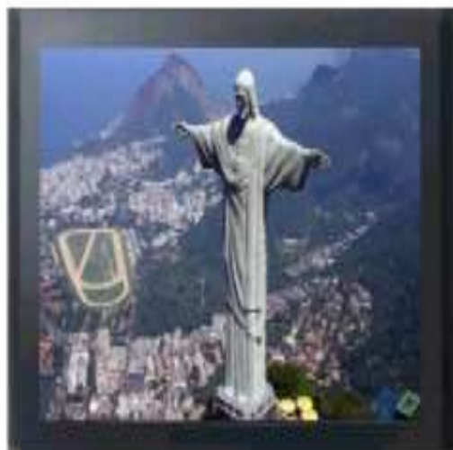
IMAGEM 16:9 ORIGINAL