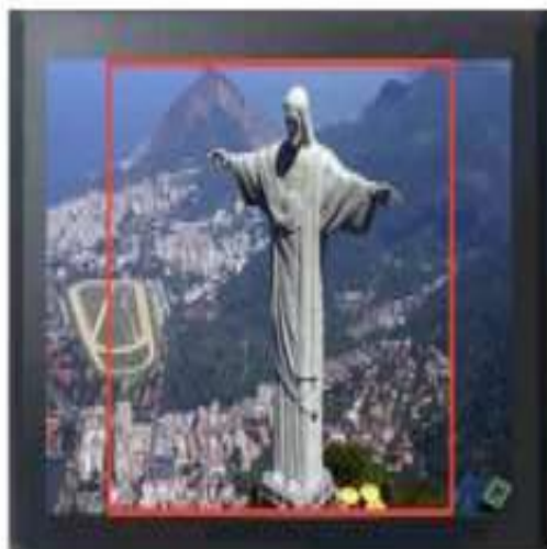
AREA DE SEGURANÇA 4:3