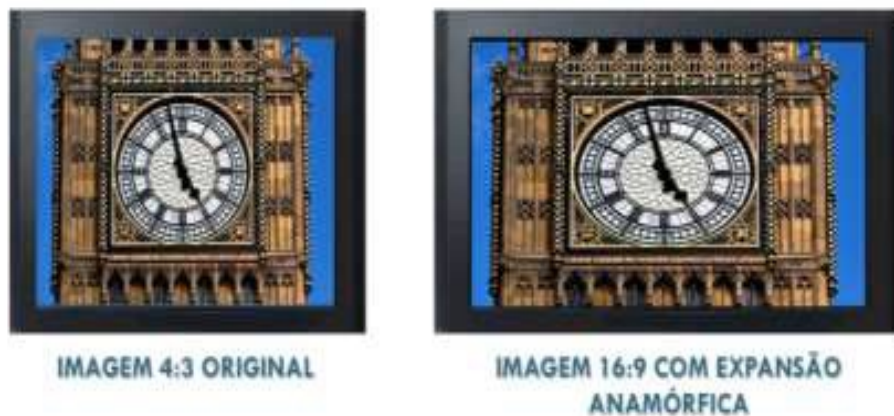
Figura 7: Upconversion Errado : Imagem convertida de 4:3 para 16:9 com Efeito de Expansão Anamórfica ou Efeito de Tela Esticada.