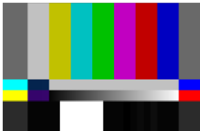
Figura 8: Sinal de COLOR BARS SMPTE em HD.