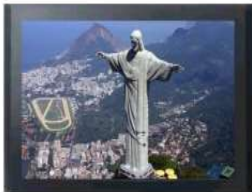
IMAGEM 16:9 ORIGINAL