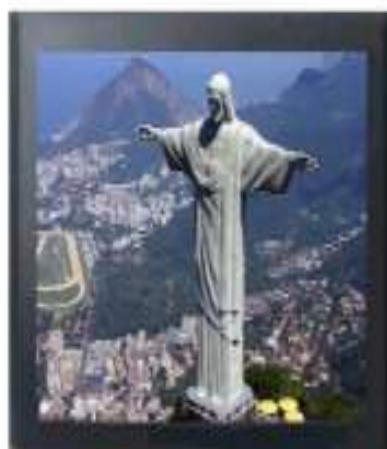
IMAGEM 4:3 COM CROP