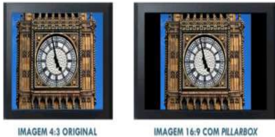
Figura 6: Upconversion Correto : Imagem convertida de 4:3 para 16:9 com Pillarbox .

gens captados em 4:3. A conversão de imagens de 4:3 para 16:9 deve ser feita adicionando pilares pretos nas laterais chamados pillarbox (ver figuras 6 e 7).