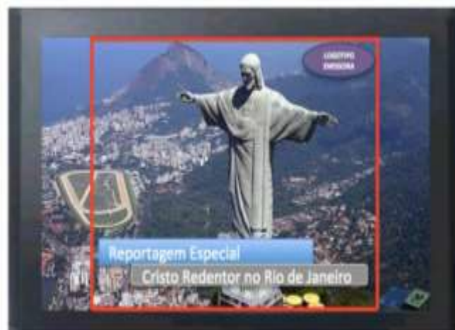
ÁREA DE CARACTERES

9.3.1. O downconversion de HD em 16:9 para SD em 4:3 deve ser feito com Crop : Prever caracteres dentro da área de segurança 4:3 ( safe title area ) no vídeo 16:9 (prever área de Crop lateral) (ver figura 5).