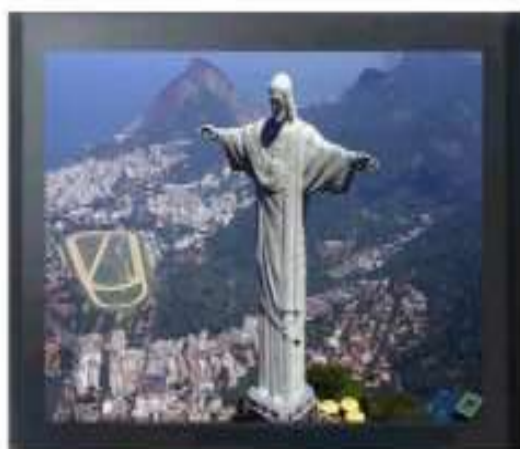
IMAGEM 16:9 ORIGINAL